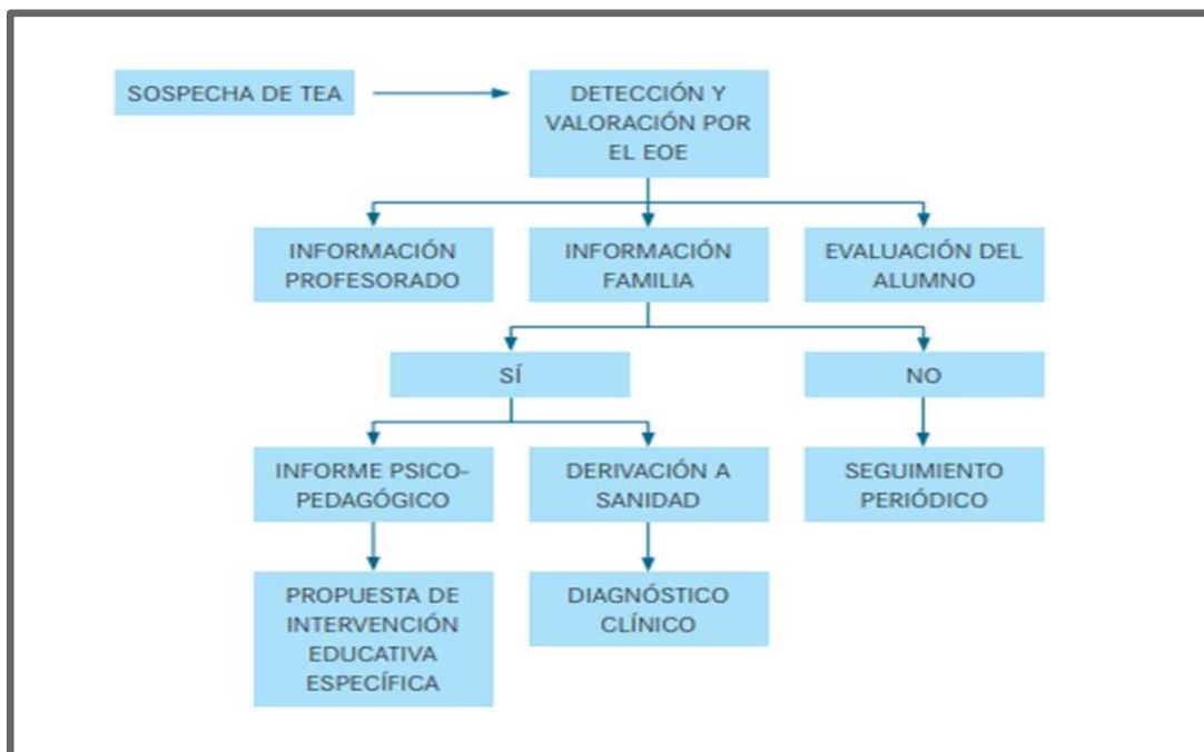
Tabla 1.-Tabla Conceptual de Detección TEA. (Federación Autismo Castilla y León , 2016)

La Declaración de Salamanca da el inicio a realizar cambios en el aula, a lo cual se suman metodologías, orientaciones del profesorado y de las instituciones educativas. Conocer las Necesidades Educativas Especiales implica que los profesores y toda la comunidad escolar debe interiorizarse, apoyar desde todos los ámbitos para que realmente se logre una educación inclusiva. Con el fin de avanzar y lograr los objetivos de la investigación en curso es necesario plantear: cuando se habla de inclusión necesariamente se debe relacionar con las eras digitales pues garantiza la participación de todos. (Fressy Andrades Ruiz, 2011).