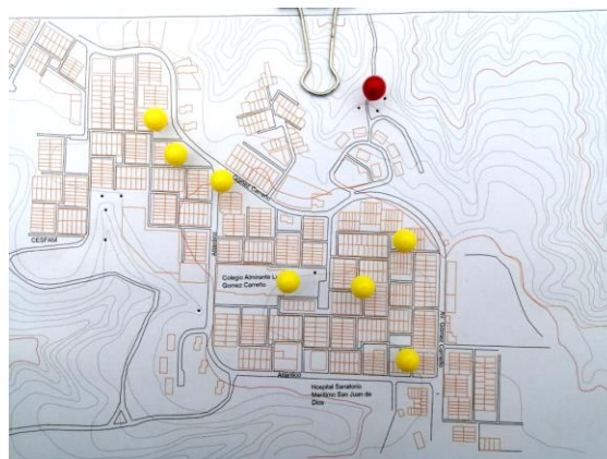
Mapeo entrevista 4

mi hija era a la V Vergara, pero esa cierra a las 6:00pm. Es un espacio verde inutilizable para la gente que trabaja hasta este horario. Entonces en invierno no puedo ir a la V Vergara entonces es un espacio que no se utiliza.