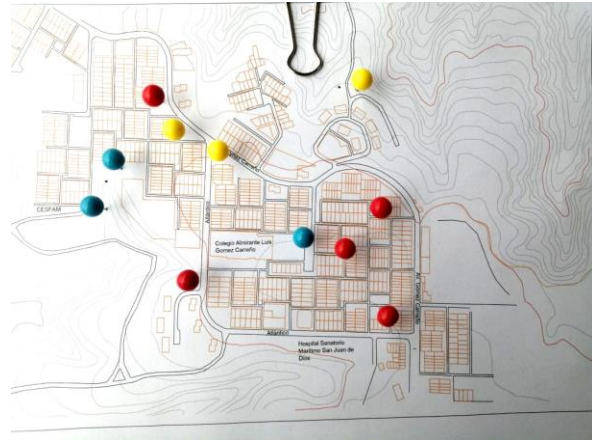
Mapeo entrevista 2

entonces hay mucho adulto mayor y donde van escalas plazas. La cancha la intervino la Coca cola, se supone que ahora la arriendan. Porque antes la cancha estaba abierta para todo el público, pero ahora no se puede y hay que arrendarla.