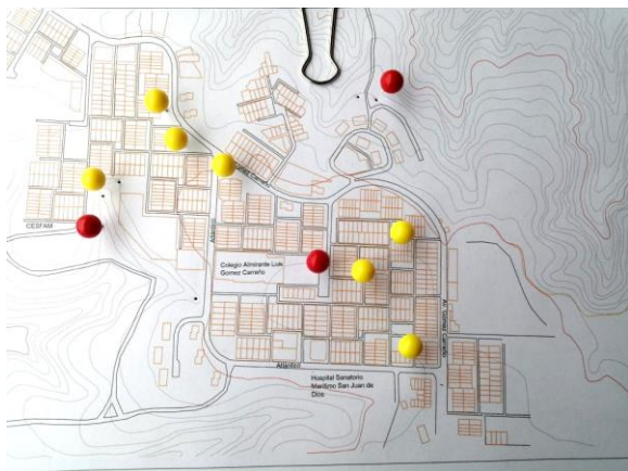
Mapeo entrevista 3