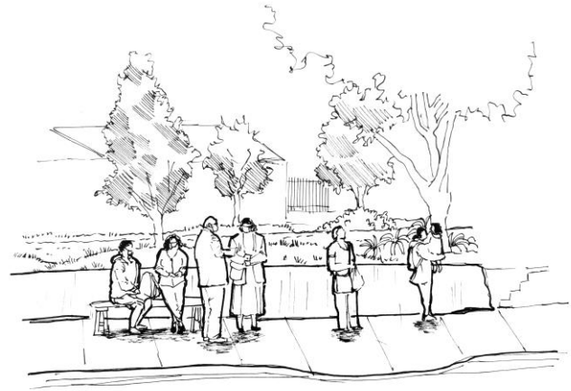
Croquis 3: El acto y las áreas verdes del espacio público en la plaza triangular 4to sector Gómez Carreño.

formando un eje de encuentros, historias y vivencias, dicho en otras palabras, los vecinos de un sector dejan su huella en las áreas verdes de su barrio, pero estas a su vez dejan su huella en cada habitante que las utiliza, recuerdos que se incrustan en la memoria emocional colectiva y también en cada usuario de los parques y plazas.