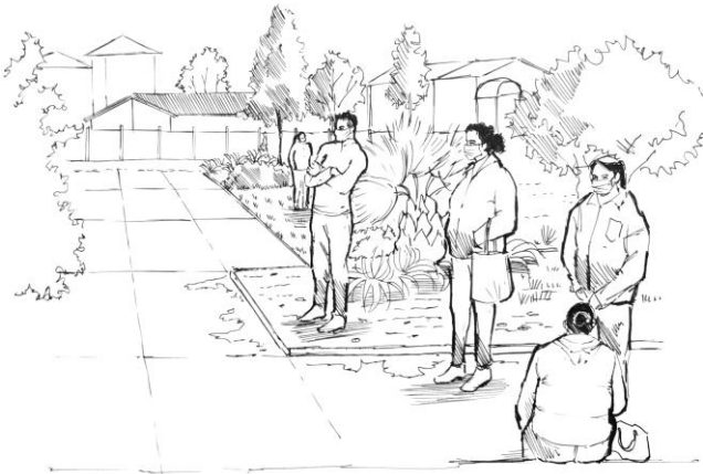
Croquis 2: El acto y las áreas verdes del espacio público en la plaza central 4to sector Gómez Carreño.

proyectos en beneficio del vecindario, notablemente las áreas verdes en ocasiones llegan a sustituir al espacio de la junta vecinal del sector al que pertenecen.