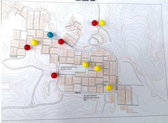
Mapeo entrevista 1

Se generan hartos encuentros en la plaza de interacción entre vecinos, entre usuarios de las casas fiscales. Durante la pandemia se hizo mal uso de la plaza ocasionalmente la usaron para alcohol.