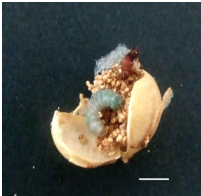
Fig. 2. Daño de larva E. zinckenella en cápsula de Alstroemeria sp. (Barra escala 0,5 cm). Fig. 2. Damaged caused by larvae of E. zinckenella in Alstroemeria sp. capsules (Scale bar 0.5 cm).

bursa. Saco secundario grande, esclerotizado, con espinas. Signum en bursa principal con espinas largas (Fig. 3D). Las características morfológicas de ambas genitalias coinciden con lo descrito por Whalley (1973) para la especie E. zinckenella .