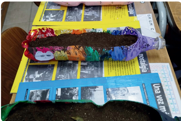
Benjamín Mateluna, jornada diurna