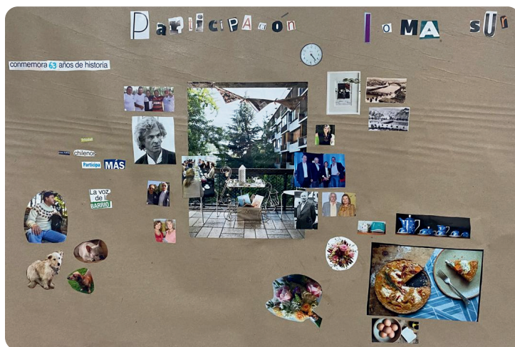
Proyecto “Loma Sur: Memorias que nos unen comunidad que florece”