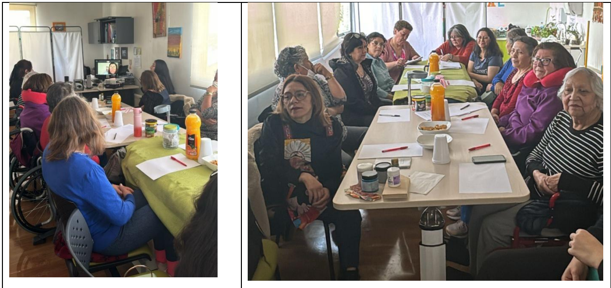
Figura 2: Fotos del proceso de diagnostico

Es relevante mencionar, que luego de la reflexión algunos miembros de la comunidad exponen la necesidad de contar con ideas o estrategias para lograr sus objetivos, lograr las tener las necesidades expuestas. Como también, requieren de la colaboración de otros, como el aporte que pueda realizar la facilitadora.