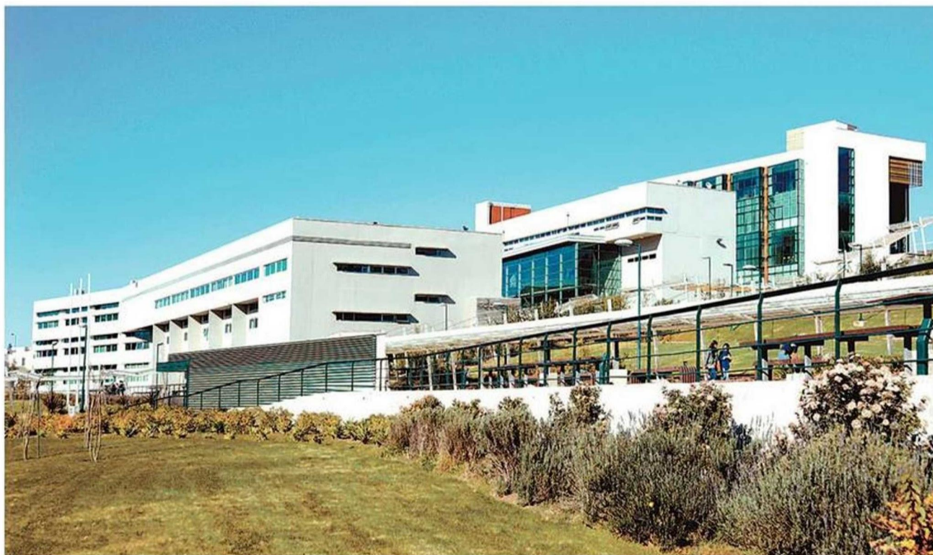
La PUCV estrenará el Doctorado en Didáctica de las Ciencias, único de su tipo en Chile.

Durante ocho semestres los futuros doctores desarrollarán una única línea de investigación que, entre otras materias, permitirá que dominen y apliquen conocimientos en Internet de las cosas (IoT), analítica del aprendizaje, pensamiento computacional, análisis de redes sociales, informática en salud y