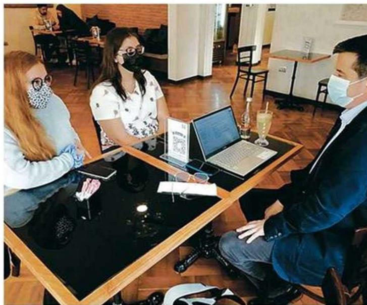
UNIVERSITARIAS REALIZARON MESA DE TRABAJO CON DIPUTADO.

las calles aledañas también han sido una preocupación, así como también aquellos estudiantes que vienen desde el Campus Curauma y regresan bastante tarde”, comentó el timonel de la FePUCV.