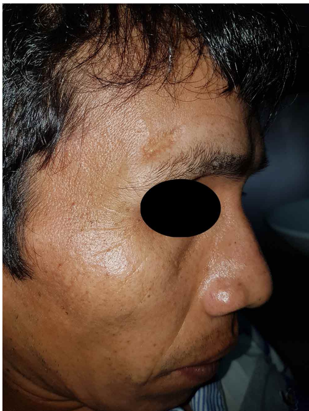
Fig. 1. Lesión cicatrizada de aspecto de "papel de cigarro" en la región supra orbitaria derecha.

La leishmaniasis afecta a hombres y mujeres en una proporción de 2:1. En pacientes inmunocomprometidos, la mucosa oral es el segundo sitio más frecuentemente afectado de la región de la cabeza y el cuello. En la cavidad oral, la lengua es el sitio más afectado. La LMC se debe a la extensión de la enfermedad local de la piel al tejido mucoso a través de la extensión directa, el torrente sanguíneo o los vasos linfáticos (Passi et al. , 2014). Se caracteriza por lesiones granulomatosas, eritema y úlceras, presentándose en mucosa de nariz, cavidad oral y faringe, llevando a la destrucción del tabique nasal. En la cavidad oral, se manifiesta principalmente en paladar duro (Cruz de Escomel) pudiendo afectar labio, úvula, en-