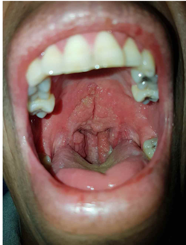
Fig. 3. Cruz de Escobel: Lesión granulomatosa dolorosa a la palpación, no sangrante.

do con dolor a la palpación, no sangrante, que se extendía desde el tercio posterior paladar del duro, hasta el paladar blando y región amigdalina, en forma de pirámide (“Cruz de Escobel”) (Fig. 3). No se palparon adenopatías cervicales. Se planteó LMC como diagnóstico presuntivo.