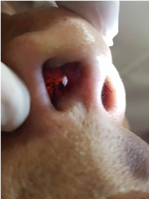
Fig.2. Perforación con erosión parcial del tabique nasal.